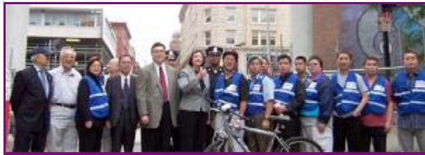
波士頓警察局長凱瑟琳·奧圖與華埠自衛巡邏隊在牌樓前合影。

華人社區主頁 華盛頓DC 美西北 紐約 新澤西 波士頓 費城 北加州 南加州 美中 美南 美東南 加拿大東 歐洲 加拿大